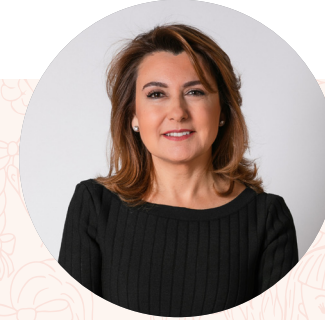
Arzuhan Doğan Yalçındağ

Türkiye Üçüncü Sektör Vakfı'nın kurucularından olan Yalçındağ, Ocak 2004'te İstanbul Modern'in de kurucuları arasında yer almıştır ve halen Yönetim Kurulu Üyesi olarak çalışmaktadır. Türkiye Vodafone Vakfı Danışma Kurulu Üyesi olan Doğan Yalçındağ aynı zamanda American Turkish Society Yönetim Kurulu Üyeliği, Contemporary Art İstanbul Danışma Kurulu Üyeliği görevlerini de sürdürmektedir. Expo 2015 Milano'nun uluslararası danışma kurulunda da görev alan Arzuhan Doğan Yalçındağ'a 2009'da İtalya Cumhuriyeti'nin Kumandan (Commendatore dell'Ordine della Stella d'Italia) nişanı verilmiştir. Dünya Ekonomik Forum'unun (WEF) Medya, Eğlence ve Enformasyon (MEI) Yürütme Kurulu Üyesi, Paley Center for Media'da Mütevelli Heyeti Üyesi ve Uluslararası Televizyon, Sanat ve Bilim Akademisi'nin Yönetim Komitesi Üyesi'dir.